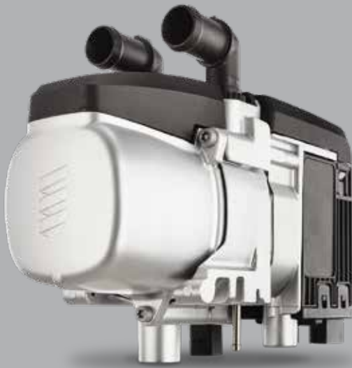
Produktabbildung zeigt nicht Serienumfang